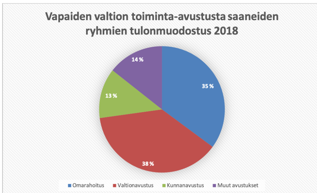
Kuva 2: Vapaiden toiminta-avustusta saaneiden ryhmien (19) tulonlähteiden jakautuminen 2018