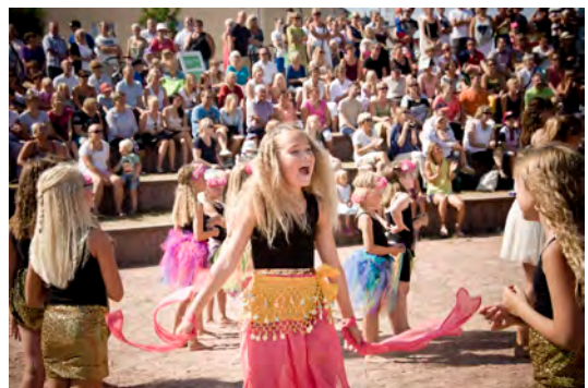
Dunderdans-koulun tanssinäytös Kedja Mariehamn, 2014.

ÅIDance-festivaali pidettiin 6.–9.8. Ohjelma sisälsi esityksiä ja tanssinäytöksiä, tanssitunteja eri lajeissa sekä tanssiparaatin. ÅIDance-festivaalin ohjelma oli