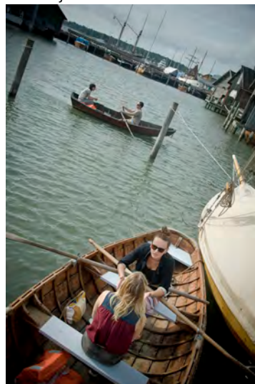
Mentoring Kedja Mariehamn 2014.

3) Kaksi sessiota, joita pidettiin päivittäin (7.–9.8.):