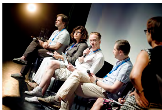
Avauskeskustelu "Sustaining Our Community" Kedja Mariehamn 2014