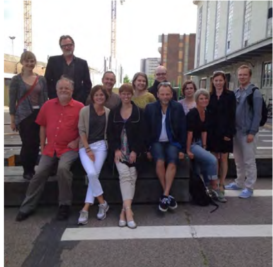
Kööpenhaminan tapaaminen, 2014

Helsingissä joulukuussa 2012 järjestetyn ensimmäisen tapaamisen tarkoitus oli käynnistää työprosessi ja esittää peruskysymykset: mitä, kenelle, miten ja miksi. Keskeisimmät kysymykset koskivat