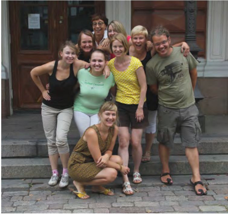
Tanssin Tiedotuskeskuksen väki Helsingissä, elokuussa 2014.