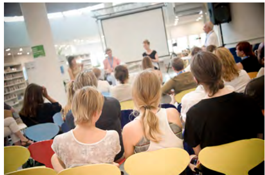
Going Wild -seminaari kaupunginkirjastossa. Kedja Mariehamn 2014.

Kaikki keöja-partnerit ja yhteistyökumppanit antoivat panoksensa ohjelmasisältöön jakamalla osahankkeittensa tuloksia inspiroivilla ja innovatiivisilla tavoilla. Myös monet suomalaiset ja paikalliset yhteistyökumppanit osallistuivat ohjelmasisällön tuottamiseen tai tukivat tapahtumaa muilla tavoin. Tapahtuman toteutus perustui vahvasti yhteistyöhön.