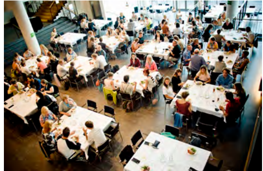
Final Party -illallinen Kedja Mariehamn, 2014.