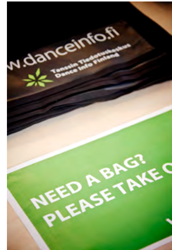
Rekisteröitymis- ja infopisteellä Keöja Mariehamn 2014.

Tapahtuman sekä erityisesti sen avoimen ohjelmaosuuden näkyvyyttä edistettiin pienellä määrällä julisteita sekä mainoslehtisiä, joita levitettiin ympäri kaupunkia. Paikallinen matkailutoimisto osallistui myös tapahtuman paikallismarkkinointiin. Tapahtumaa nostettiin esille paikallisissa verkossa toimivissa ja painetuissa tapahtumakalentereissa.