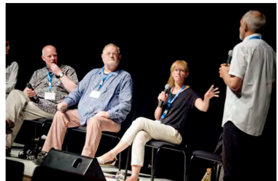
Päätöskeskustelu "Building New Bridges" Kuva:© Uupi Tirronen. Kedja Mariehamn 2014

Touring Think Tankin työprosessia ja lopputuloksia jaettiin laajemman yleisön kanssa kahdessa eri keöja-tapahtumassa: keskustelutilaisuudessa keöjaKlaipedassa kesäkuussa 2013 ja keöjaMariehamn-tapahtumassa elokuussa 2014. Maarianhaminassa aihetta käsiteltiin keskustelutilaisuudessa, jossa avattiin sekä prosessia että lopputulosta ja koko tapahtuman verkostojen merkitystä ja tulevaisuutta käsittelevän päätöskeskustelun yhtenä aiheena. Kaikkia tilaisuuksia hyödynnettiin kiertuetoiminnan ja verkoston perustamisen tavoitteiden, motiivien ja haasteiden viestinnässä.