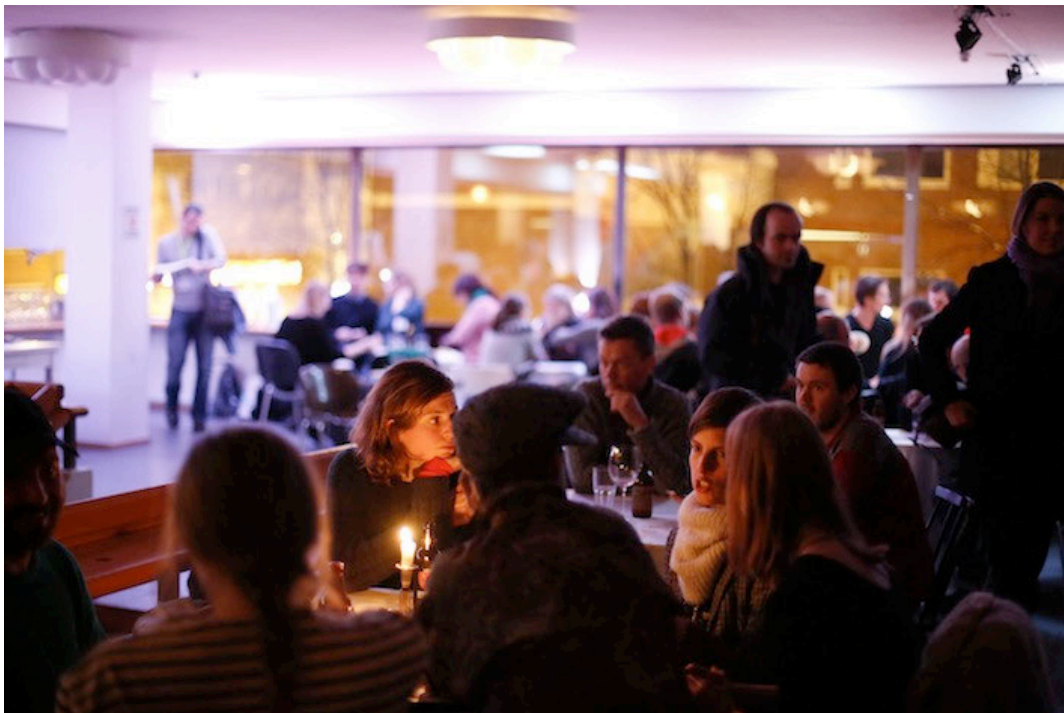
Iltakokoontuminen KokoTeatterilla.

ICE HOT Nordic Dance Platform Helsinki päättyi sunnuntaiaamuna Ravintola Kaisaniemessä järjestettyyn jäähyväisbrunssiin. ICE HOT -katselmuksen vetovastuu luovutettiin Norjan tanssin talolle, Dansens Husille, joka järjestää seuraavan katselmuksen Oslossa vuonna 2014. Lisäksi partnerit esittelivät lyhyesti hankkeen tulevaisuudensuunnitelmia Pohjoismaiden ulkopuolella tapahtuvasta toiminnasta. Brunssille osallistui noin 50 vierasta.