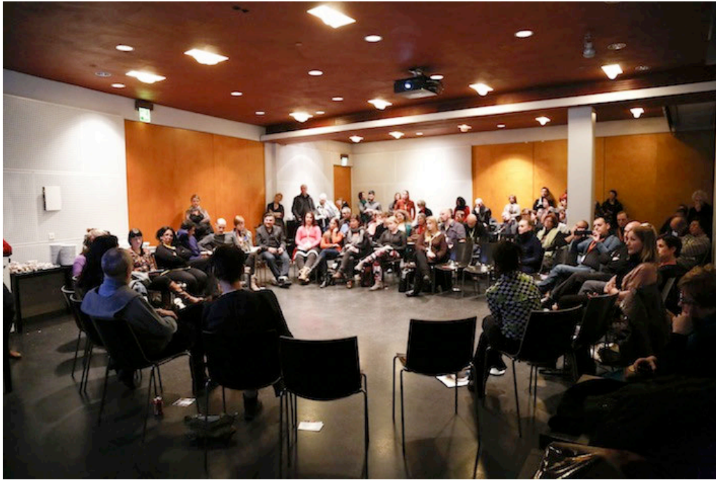
Infotilaisuus: Kohti Etelä-Amerikkaa.

Viimeisen päivän infotilaisuudessa Etelä-Amerikan alueen tanssin ja esittävän taiteen kentän toimijat esittelivät monimuotoista maanosaansa. Tilaisuus oli osa ICE HOT -hankkeen aloitetta rakentaa yhteistyömalleja Pohjois-Euroopan ja Etelä-Amerikan välille.