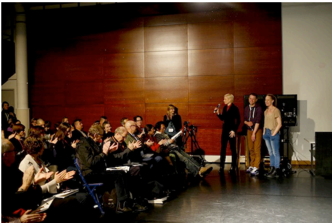
More, More, More.

More, More, More herätti positiivista huomiota jo Tukholman tapahtumassa, ja konsepti päätettiin ottaa osaksi myös Helsingin ohjelmaa. Tälläkin kertaa More, More, More oli menestyksekkäs, ja osallistujat antoivat ohjelmaosiolle keskiarvosanaksi 4,08 asteikolla yhdestä viiteen. Tapahtuman kolme More, More, More -tilaisuutta keräsivät yhteensä 212 osallistujaa.