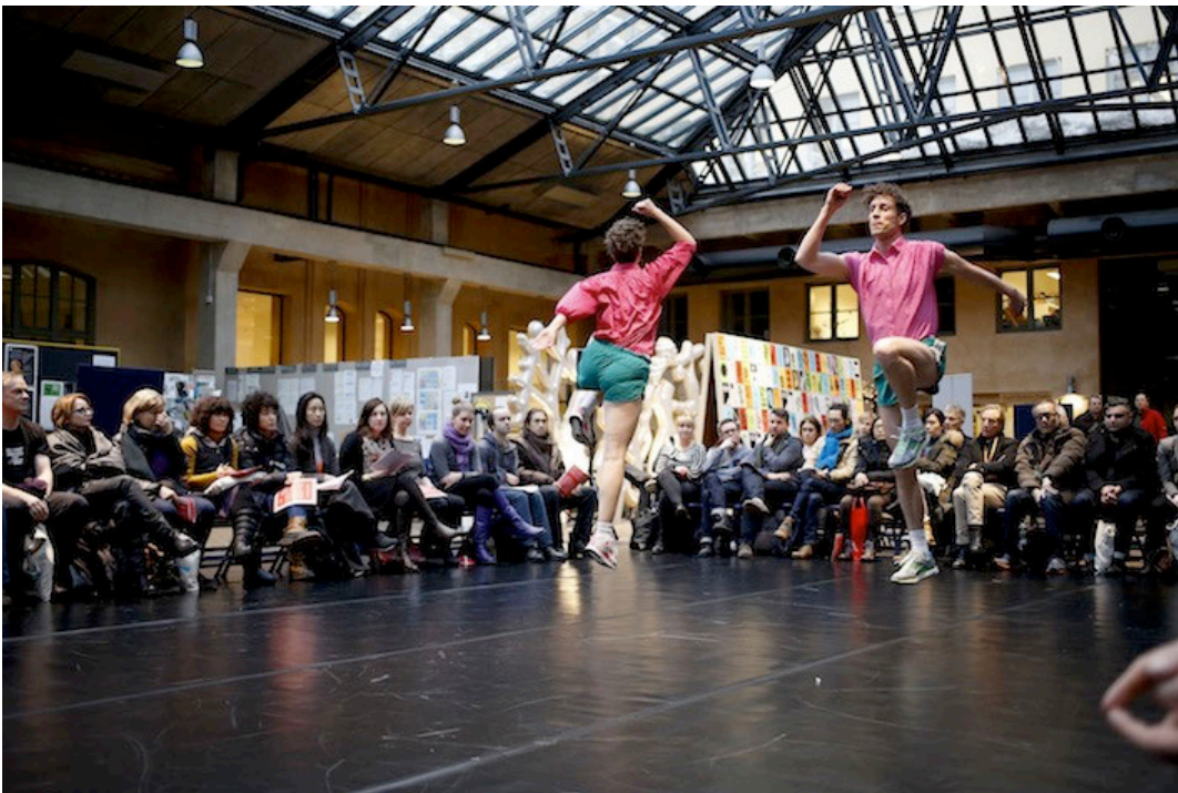
Bastardproduktion: Roses & Beans Teatterikorkeakoulun Torilla.

Tapahtuman keskuspaikkana toimi Teatterikorkeakoulu. Teatterikorkeakoululla oli tapahtuman rekisteröitymis- ja infopiste, ja koulun tiloissa järjestettiin More, More, More -ohjelmaosio sekä suurin osa seminaariohjelmasta. Esitysohjelmiston yksi teos esitettiin Teatterikorkeakoulun Torilla ja kolme teosta studionäyttämöillä. Teatterikorkeakoulussa järjestettiin myös useita verkostotapaamisia.